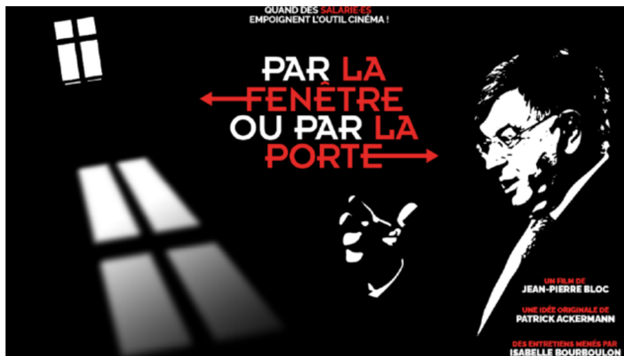
AFICHEL DEL DOCUMENTAL "POR LA VENTANA O POR LA PUERTA" DE JEAN PIERRE BLOC. © PAR LA FENÊTRE OU PAR LA PORTE

"Por la ventana o por la puerta" es la frase tristemente célebre del antiguo presidente de France Télécom, empresa telefónica que registró varios suicidios de sus empleados. El documental retrata la batalla judicial para condenar a sus directivos por acoso moral institucionalizado. Su condena marca un antes y un después respecto a la gestión de personal y a la salud en el ámbito laboral.