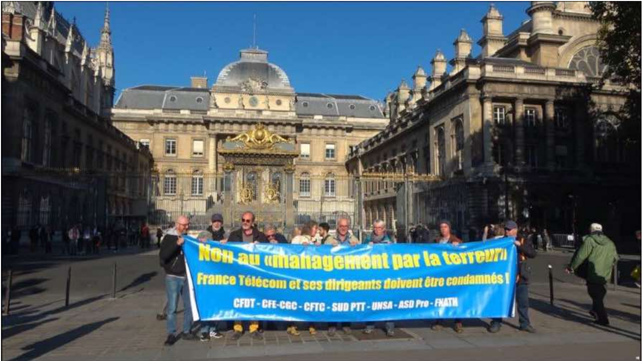
PAR LA FENÊTRE OU PAR LA PORTE DE JEAN-PIERRE BLOC © VRAI VRAI FILMS

Suite au récent procès condamnant les responsables des suicides des employé.e.s de France Telecom causés par la violence des nouvelles techniques managériales, salarié.e.s et syndicalistes racontent l'histoire d'une banalisation du mal à l'époque contemporaine.