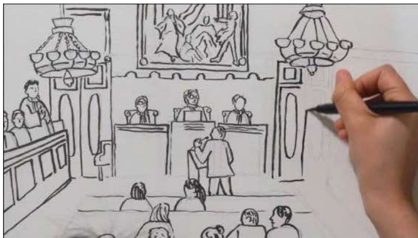
Par la fenêtre et par la porte (2023, 90 mn)

Septembre 2004, l'État privatise son fleuron historique France Télécom.